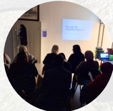
Le bilan de compétences