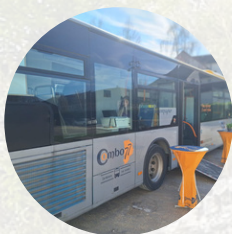
Le bar à CV