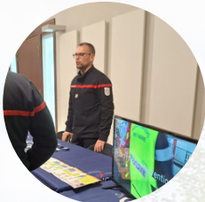
Les gestes qui sauvent