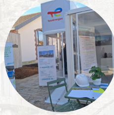
Le Galaxie Cube de TotalEnergies