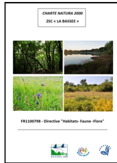
Charte de la ZSC

Bien qu'elle ne donne pas droit à une contrepartie financière au même titre que la contractualisation, l'adhésion à la charte donne accès à certains avantages fiscaux et à certaines aides publiques : exonération de la taxe foncière sur les propriétés non bâties, exonération des droits de mutation et déduction du revenu net imposable des charges de propriétés rurales.