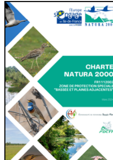
Charte de la ZPS