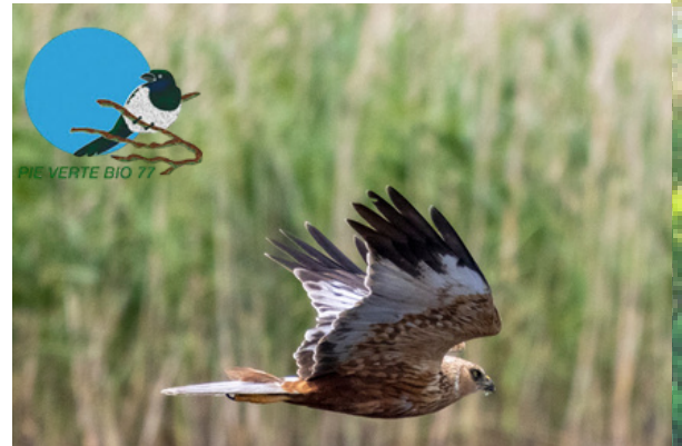
Le Busard des roseaux est « en danger critique d'extinction » sur la liste rouge des oiseaux d'Ile-de-France

Le suivi des 3 espèces de Busard est assuré en Bassée par la Fédération des Chasseurs de Seine-et-Marne appuyée par les volontaires de l'association Pie Verte Bio 77 .