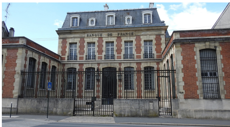
Ancienne Banque de France

La culture et le patrimoine sont également un autre axe fort de cette programmation, avec 14 projets financés pour un total de plus de 5 millions € . La rénovation de la maison dans la vallée, qui accueille le centre culturel d'Avon, la réhabilitation des locaux de l'ancienne Banque de France à Coulommiers, la restauration de l'église Saint-Aspais à Melun, sont quelques-uns des dossiers retenus.