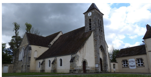
Eglise de Beauvoir

En soutenant l'investissement des collectivités, il s'agit pour l'État de dynamiser l'économie locale et d'accélérer la réalisation de projets du quotidien, concrets pour nos concitoyens, dans les grandes agglomérations comme dans les petites communes rurales, dans les quartiers prioritaires de la politique de la ville comme dans les sites patrimoniaux remarquables :