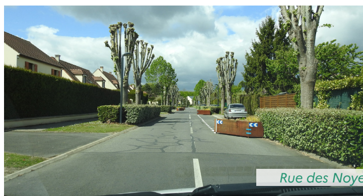
Rue des Noyers à Collégien

Le plan de relance promeut également les mobilités douces. Deux projets dans ce domaine vont bénéficier de subventions pour un total de plus de 900 000 € : la création d'une piste cyclable rue des Noyers à Collégien, et la mise en place d'un réseau de circulations douces à Crécyl-la-Chapelle. Ces financements s'ajoutent à ceux mobilisés dans le cadre du plan vélo et constituent une nouvelle illustration de la forte mobilisation de l'État en Seine-et-Marne, aux côtés des collectivités, pour augmenter la part des modes doux dans les déplacements du quotidien, avec des résultats tangibles : entre 2017 et 2020, le nombre de km d'aménagements cyclables sécurisés a augmenté de 37 % ( cf. baromètre de l'action publique ).