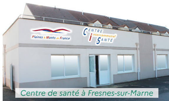
Centre de santé à Fresnes-sur-Marne