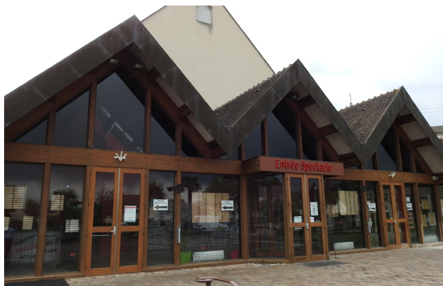
Centre culturel, la Maison dans la Vallée