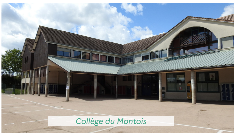
Collège du Montois

Montois à Donnemarie-Dontilly, le groupe scolaire Les Ormes à Savigny-le-Temple ou encore le groupe scolaire Lavoisier à Emerainville, avec des gains énergétiques pouvant atteindre 46 % comme à Perthes-en-Gâtinais pour l'école élémentaire « les Tilleuls ».