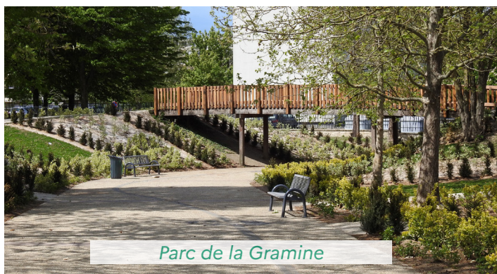
Parc de la Gramine

Les quartiers prioritaires de la politique de la ville de Seine-et-Marne vont bénéficier de plus d'1,8 million € pour le financement de projets d'aménagement urbain comme celui du parc de la Gramine dans le quartier de Surville, à Montereau-Fault-Yonne, et de rénovation d'équipements publics, à l'image de la réhabilitation-extension du gymnase Champbenoist, à Provins, subventionnée à 80%.