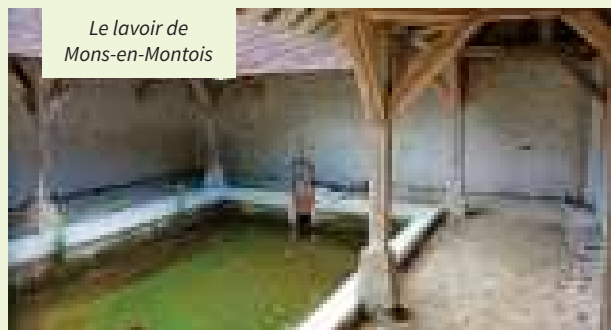
Le lavoir de Mons-en-Montois

Le lavoir est alimenté par le rû de Mons, qui prend naissance à la source Saint-Fiacre. Réputée pour guérir « les maladies du fondement », les maux du bas-ventre notamment, cette source fit ainsi l'objet de nombreux pèlerinages.