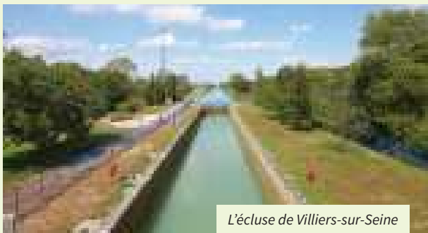
L'écluse de Villiers-sur-Seine

Editoir Provins Tourisme - Codérando 77 - Conception et réalisation : CréaClic - 07/2020 - Informations susceptibles de modifications