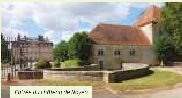
Entrée du château de Noyen

Sa construction date des XII e et XVI e siècles. Sous l'autel est inhumé le cœur de François de Carnavalet.