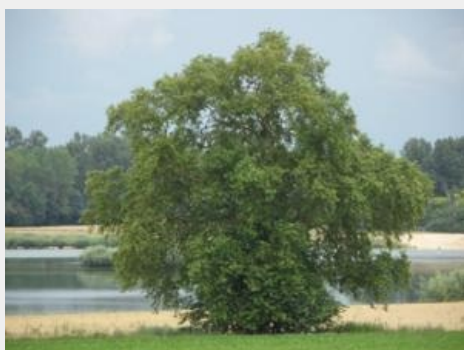
Arbre de Balloy

De nombreux vestiges témoignent d'un riche passé (hôtel des Renaudins, château et son parc, corps de ferme). Le point culminant de la plaine offre une magnifique vue de la Bassée et invite à partir à la découverte de ce milieu où l'eau et la végétation ont créé une multitude de lieux de promenade, de pêche, d'observation, en un mot : de détente. A la frontière de ces deux espaces se dresse un majestueux platane, classé arbre remarquable de Seine-et-Marne.