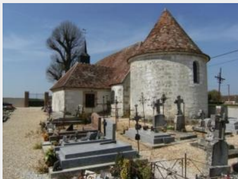
Chapelle de Baby.

La chapelle seigneuriale de Baby, unique dans la Bassée, fait partie d'un château édifié au XVIIIème et détruit au début du XIXème. Celle-ci a, dans les années antérieures, subi une très grande restauration respectant rigoureusement ses origines.